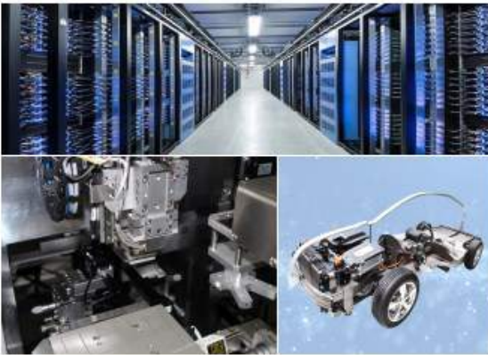
应用场景：节能、环保型设备以及医疗、安防、数据中心等设备的配套

公司的工业控制用变压器主要应用于节能、环保型设备以及医疗、安防、数据中心等设备的配套，产品包括：环形变压器、方形变压器、开关电源、移相变压器、干式变压器等。该类产品对电压调整率、阻抗电压、移相角度、电压精度、谐波、使用环境等方面有特殊要求，大部分属于定制类产品。工业控制用变压器产品的客户主要是国际、国内一流的工业控制设备制造商，如日立、明电舍、博世、罗克韦尔、施耐德等。