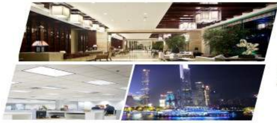
应用场景：商业、家居及户外照明