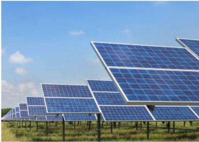
应用场景：光伏发电